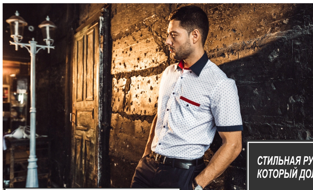
Рубашка с коротким рукавом

СТИЛЬНАЯ РУБАШКА- МУЖСКОЙ АССОРТИМЕНТ, КОТОРЫЙ ДОЛЖЕН БЫТЬ В КАЖДОМ МУЖСКОМ МАГАЗИНЕ